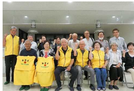
ささえ愛高野口のみなさま