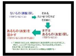
オンラインで開催