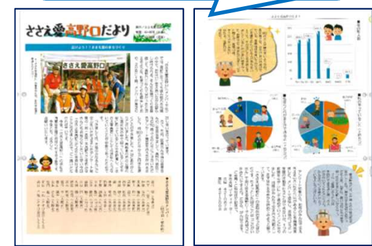
ささえ愛高野口だより 第1号