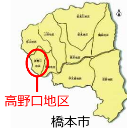
高野口地区 橋本市