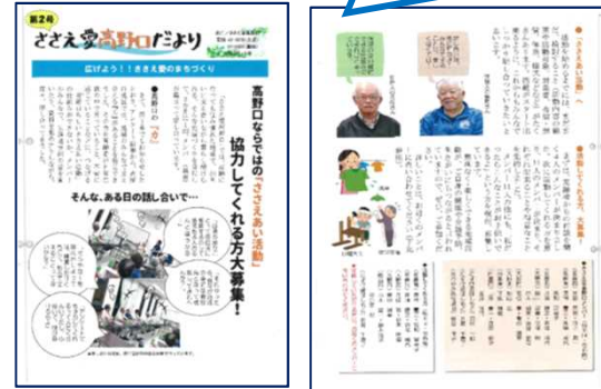
ささえ愛高野口だより 第2号