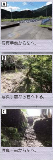
A 写真手前から左へ。 B 写真手前から右へ下る。 C 写真手前から左へ。

1 子安地藏堂 江戸時代に地元の人々によって建立され、江戸時代後期に一度再建された。龍神村唯一の規模を誇る地藏堂である。 2 東光寺薬師堂 東光寺は山岳信仰の宿坊として賑わったが、秀吉の紀州攻めの際に焼失した。再建された東光寺には薬師堂のほか、田辺市指定文化財の宝篋印塔などがある。 3 玉置紋之助の墓 玉置紋之助は鶴ヶ城城主玉置氏の末裔で、江戸時代に大庄屋の横暴に抵抗した後獄死した。住民からは「紋殿さん」と親しまれている。田辺市指定文化財。