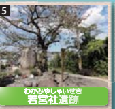
5 わかみやしんじや 若宮社遺跡 若宮社は古くから熊野古道の守護神として鎮座し、郷人や旅人の信仰を集めた。近代、中山王子社に合祀されたが、この聖地を後世に残すために石碑が置かれた。