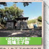
8 いわのぶがうしじんじや 斑鳩王子跡 熊野九十九王子の中でも最も創建の古い神社で、平安時代、塩屋、切目、岩代の各王子とともに崇められた。現在は祠を残すのみである。