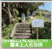
3 とくほんしょうにのみやうとうし 徳本上人名号碑 江戸時代後期の僧侶、徳本上人を称える石碑。昼夜を問わず修行に勤しんだとされ、その足跡は名号碑として広く日本各地に残されている。