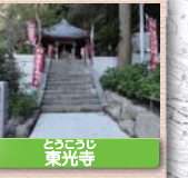
10 とうこうじ 東光寺 小栗判官・熊手姫の伝説が伝えられ、薬師如来の霊場としても信仰を集めている。また、医師未開の時代には施療の本拠として庶民の生活を支えてきた。