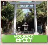
1 いわのおうし 岩代王子 明治時代に王子神社となり八幡神社に合祀されたが、合祀に関係した人が病に倒れたり、海難事故が相次いだため、社殿は旧地に建てられたという。