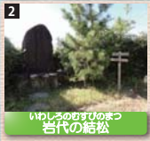
2 いわしのむすひのまつ 岩代の結松 悲劇の皇子、有間皇子が謀反の罪で護送される途中、自身の平穏無事を祈り、当地に松の枝を結んだという言い伝えがある。