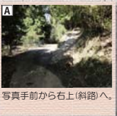
A 写真手前から右上(斜路)へ。