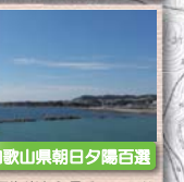
9 和歌山県朝日夕陽百選 風早海岸から見る日の入りは辺りを真赤に染め、夕陽の帯が水平線まで続く。