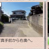
E 写真手前から右奥へ。