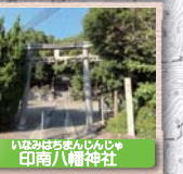
11 いなひはちまんじんじや 印南八幡神社 印南八幡神社の例祭は、400年以上の歴史があるといわれ、秋になると紀南地方の先陣をきって、印南八幡と山口八幡の例祭が行われる。