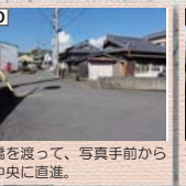
D 橋を渡って、写真手前から中央に直進。