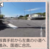
C 写真手前から左奥の小道へ進み、国道に合流。