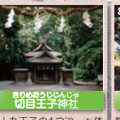
7 きりめおうしじんじや 切目王子神社 九十九王子の1つで、五体王子の1社。熊野権現が一時鎮座した地であったともいう。ナギを神木とし、本尊は十一面観音。県指定史跡。