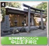
4 なかやまおうしじんじや 中山王子神社 元々神社地より東の土子の谷と呼ばれる地にあったと伝えられている。平安時代の史料「熊野御幸記」にもこの名が見える。