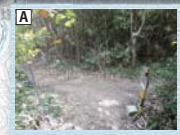
A 写真手前から右へ。 B 写真手前から奥へ(右へ進まない)。