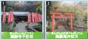
1 施福寺の参拝者用駐車場の正面に建立されており、不動明王が祀られている。また、他にも境内には多くの地蔵が祀られている。 2 社内の奥には弘法大師が修行に使ったと言われている落差およそ50mの滝がある。弘法大師の他、役行者、愛染明王等が祀られている。