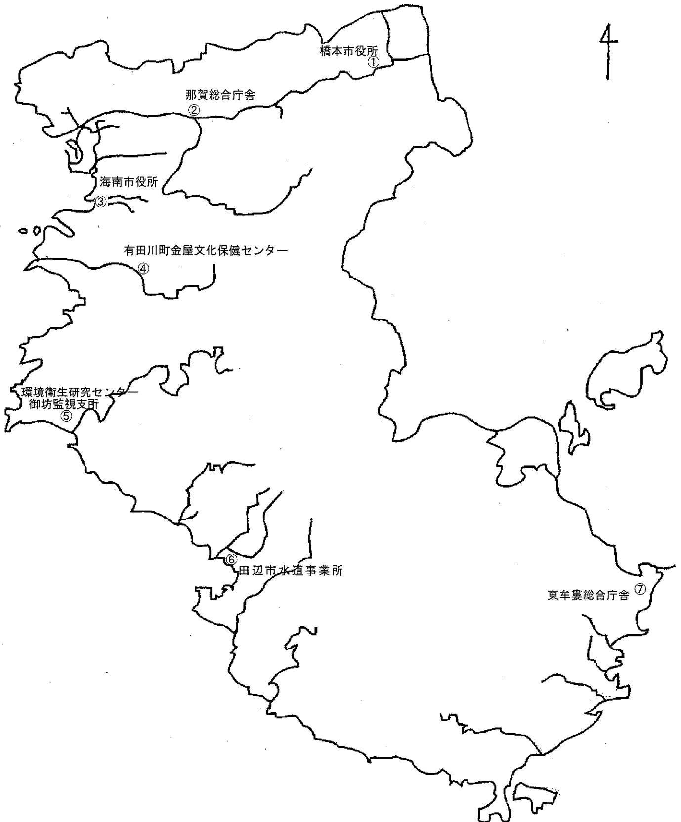
別図1 大気調査地点図