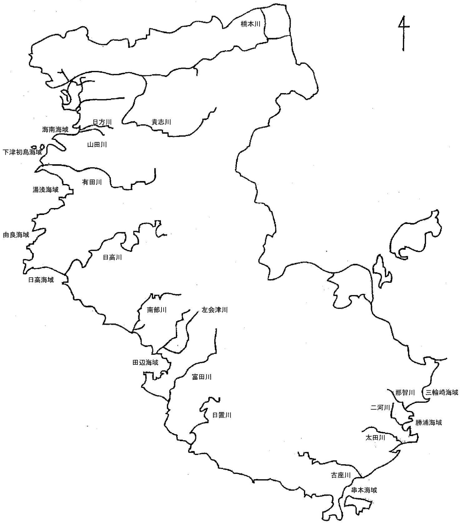
別図2 公共用水域調査地点図(全体)