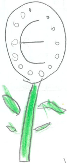
ヨーロッパ連合を 始めとする28ヶ国