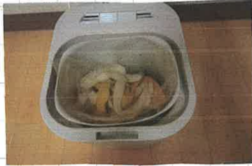
その生ゴミをかんそら機に入れる。