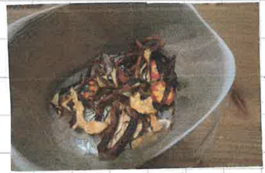
かんそらさせた生ゴミ。