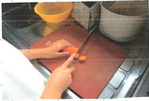
料理のときに出る生ゴミ。