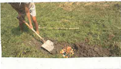
火田にあなをほってかんそらさせた生ゴミをうめる。