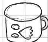
プラスチックコップ