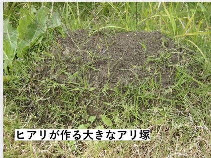
ヒアリが作る大きなアリ塚

これまで存在していなかった危険な毒アリが国内で現れています。 もし発見しても、 決して触らないでください！