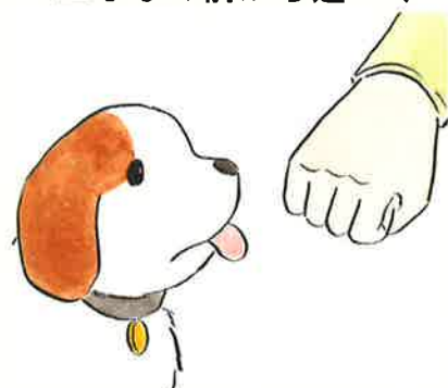
▲手はかるくにぎる