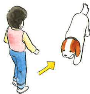
▲ななめ前から近づく