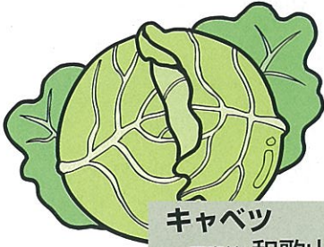
キャベツ 原産地 和歌山県