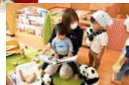
企業内保育園「キラボシ」の様子