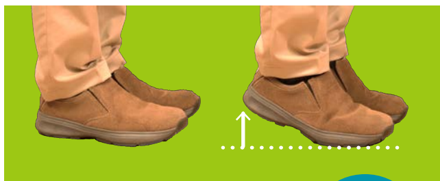
① 両足を揃えて立ち、かかとをピンポン玉1個分程度の高さにゆっくり上げ、ゆっくり下げる。