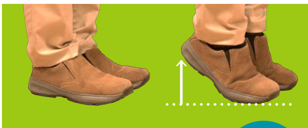
② 今度は、自分が可能な目いっぱいなところまでゆっくり上げ、ゆっくり下げる。