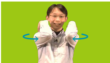
② 両手を肩に付けたまま、ゆっくり両肘を前に動かす