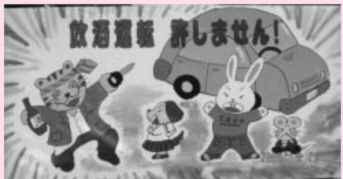
交通安全フェア2006ペイントコンテスト優秀賞 作者：和歌山西地区交通安全母の会