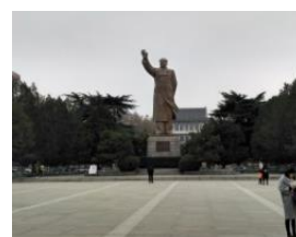
学校内の毛沢東像