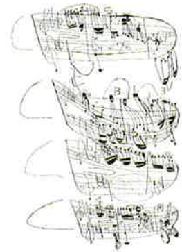
西岡弘治《楽譜 b b b b》2009年