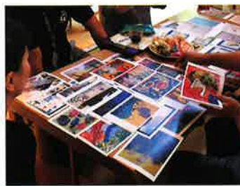
地元民間事業者とコラボし、障害者アートを活かした商品開発プロジェクトを企画中。

障害者アートの作品は、福祉施設による商品化や企業や団体とのコラボレーションなど様々な可能性を広げています。障害のある人と社会を、アートやデザインを媒介して結びつけるような優れた事例を紹介します。