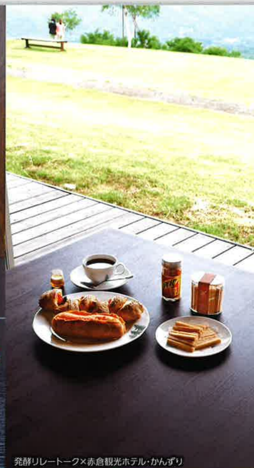
発酵リレートーク×赤倉観光ホテル・かんずり