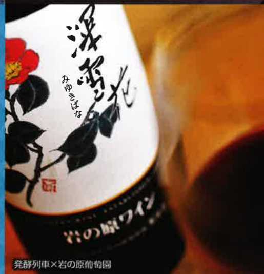
発酵列車×岩の原葡萄園