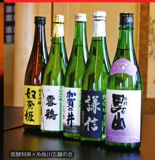
発酵列車×糸魚川五蔵の会