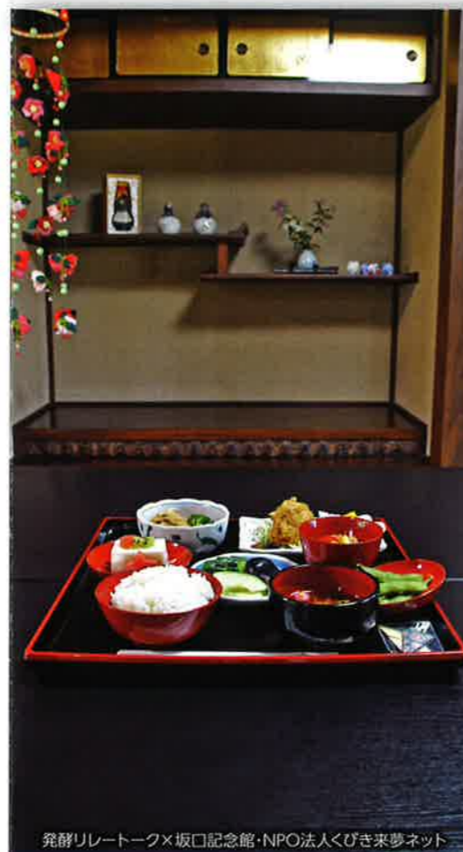
発酵リレートーク×坂口記念館・NPO法人くびき来夢ネット