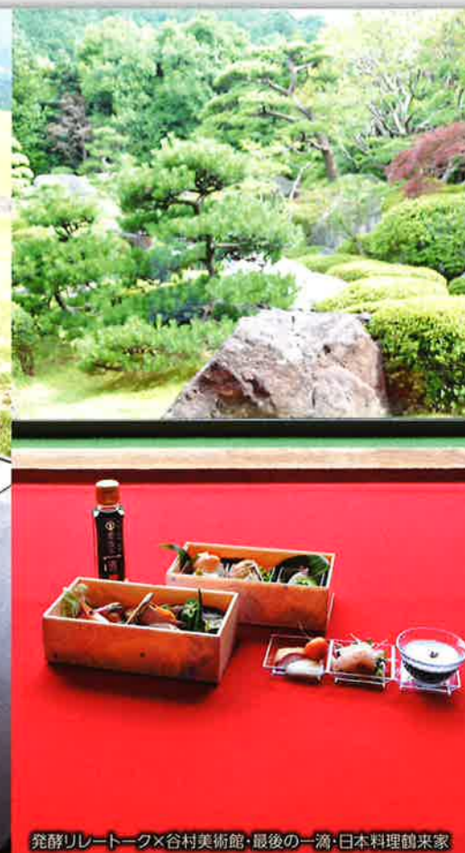
発酵リレートーク×谷村美術館・最後の一滴・日本料理師来家