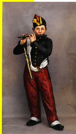
エドゥアール・マネ 《笛を吹く少年・複製》立体再現