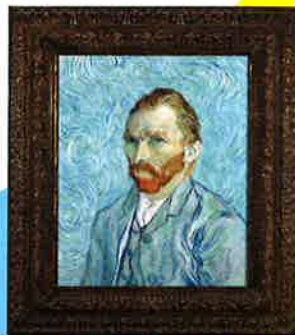
フィンセント・ファン・ゴッホ 《自画像・複製》