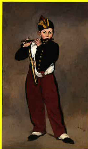
エドゥアール・マネ 《笛を吹く少年・複製》