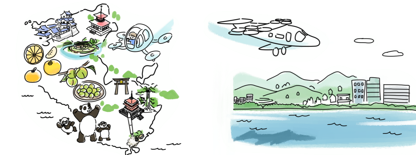
① 県内に点在する多くの魅力的な観光地

和歌山県が有する豊かな観光資源に加え、空飛ぶクルマの安全で快適なフライトの障害となる要素が少ないことが和歌山県で社会実装を進める上では大きな強みです。