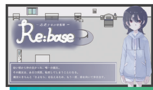
Re:base-逃避少女の快復譚-