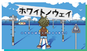
ホワイトノウェイ