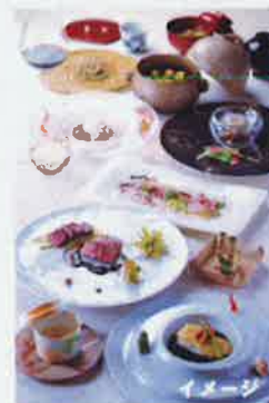
山荘天の里 ディナーペア招待券