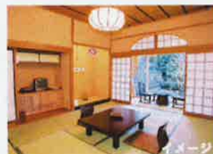
高野山宿坊 1泊2日ペア宿泊券

前期：平成29年10月14日（土）～11月30日（木） 後期：平成29年12月1日（金）～平成30年3月25日（日）