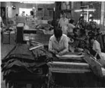
(株)フレック[紀美野町]

(株)フレックでは、防水・防寒着などが製造されています。通勤や通学用から水産業に関わるプロの方まで幅広く、あらゆる場面で使用されています。