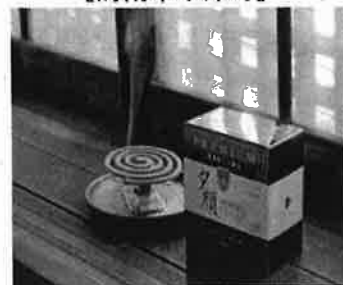
紀陽除虫菊(株) [海南省下津町]

「紀陽除虫菊(株)」では、入浴剤や蚊取り線香などが製造されています。一世紀を超える伝統と独自の想像力で多彩な商品を生み出されています。