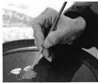
うるわし館[海南省]

うるわし館では、紀州漆器の伝統技法である「蒔絵」を体験することができます。仕上がった作品は、お土産として持ち帰ることができます。