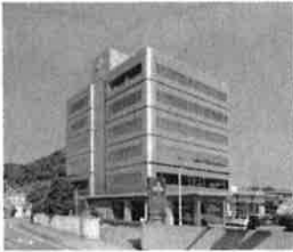
(株)サンコー[海南省]

(株)サンコーでは、キッチンやバス・トイレなどで使用される様々な日用家庭用品が製造されています。使用する人のニーズに応えた商品を数多く生産されています。