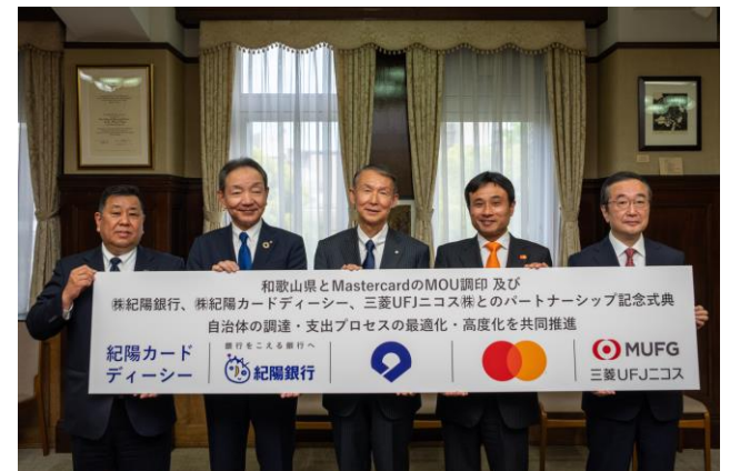
令和5年5月8日「MOU調印及びパートナーシップ記念式典」