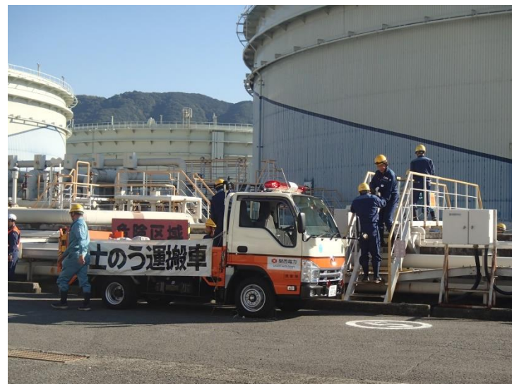
原油流出防御訓練(陸上訓練)