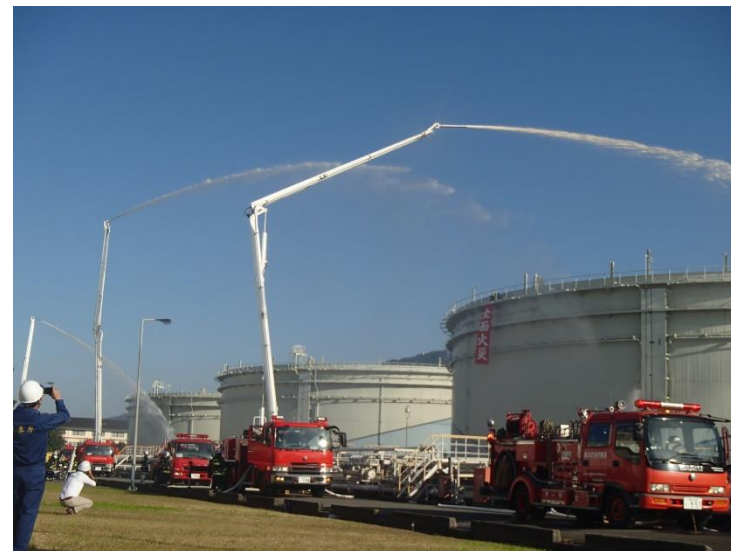
タンク火災消火訓練(陸上訓練)