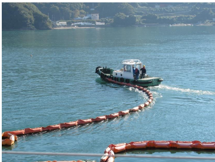
流出油防除訓練(海上訓練)