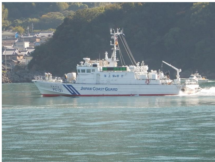
情報収集・伝達訓練(海上訓練)