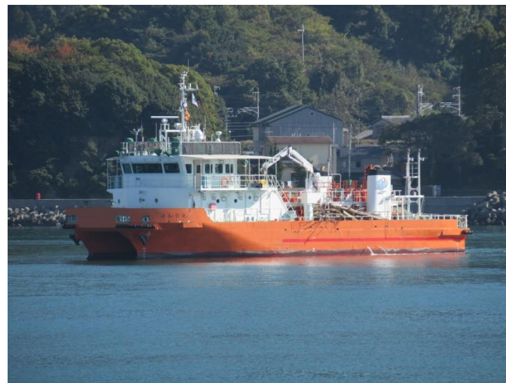
流出油防除訓練(海上訓練)