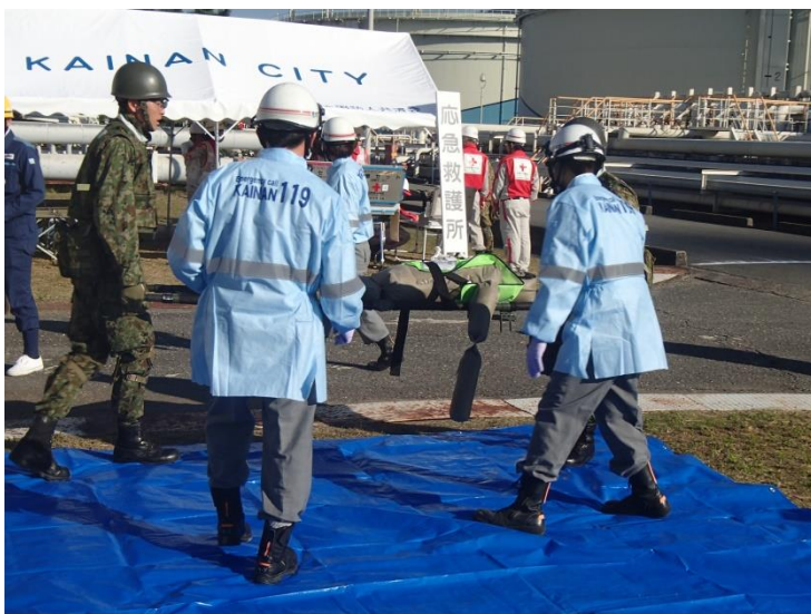
負傷者救出・救護訓練(陸上訓練)