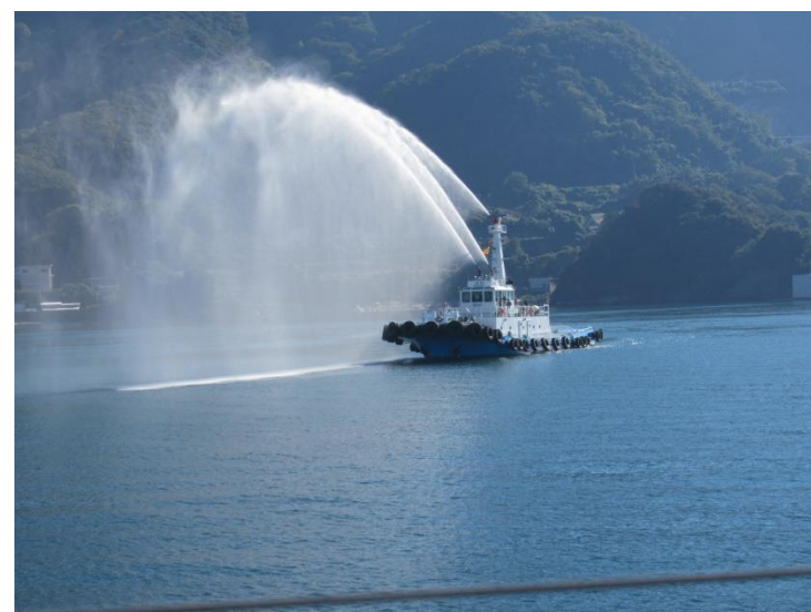
流出油防除訓練(海上訓練)