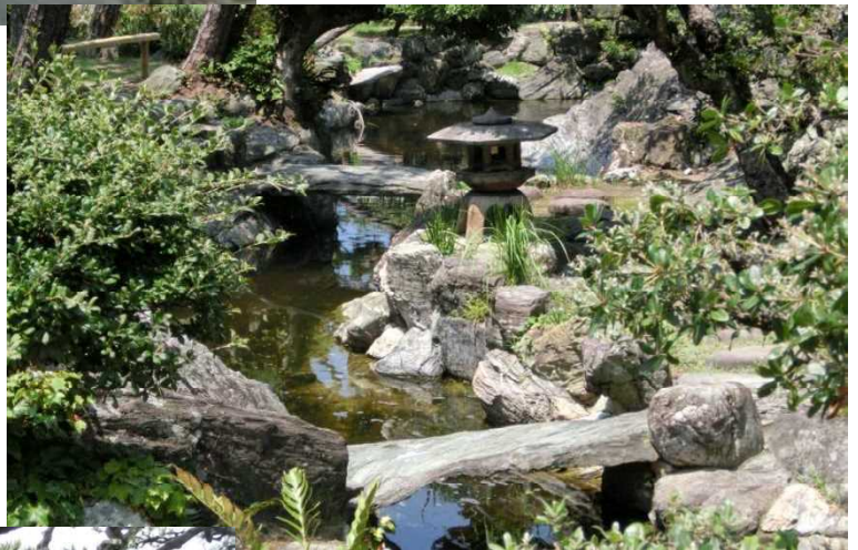
右 公館内にある池