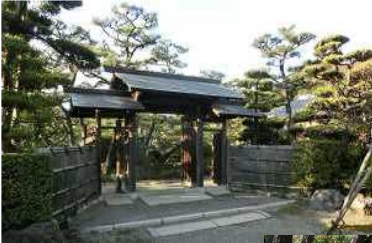
左 公館内にある門