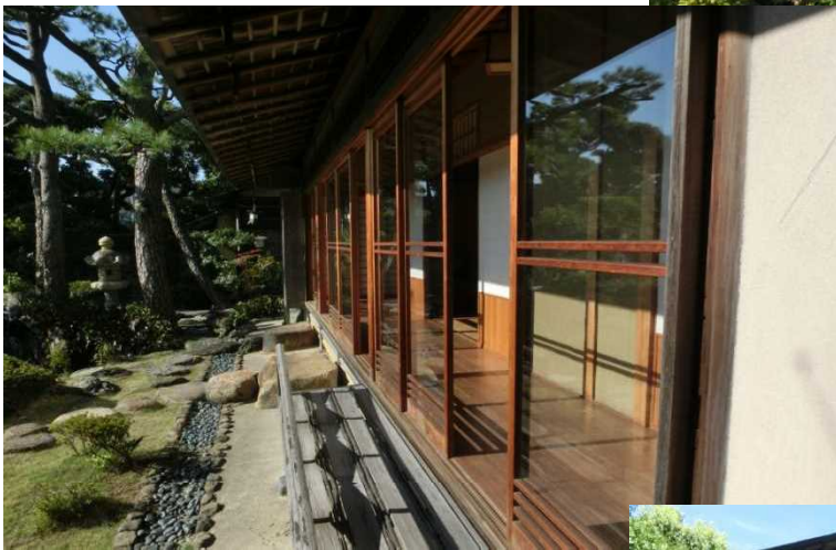
左 和館を横から望む