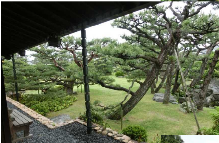
左 洋館内から眺めた庭園