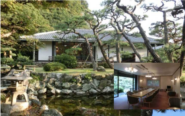
左 池越しに眺めた洋館