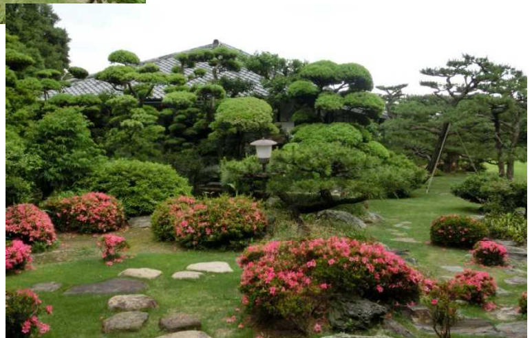
上 和館内から眺めた庭園