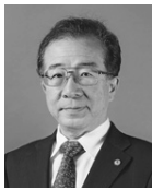
最高裁判所判事 深山 卓也 昭和三十九年九月二日生

略歴 昭和三十七年 四月 東京都生まれ。練馬区立大泉南小学校、大泉第二中学校、都立富士高等学校を経て、東京大学法学部卒業。 昭和三十七年 四月 判事補任官。以後、福岡高裁那珂支部、東京地方法学療法部卒業。 平成 四年 四月 公署等調整委員会事務局に勤務。東京地方法学療法部判事任官。以後、福岡高裁那珂支部、東京地裁、東京高裁の判事として勤務するとともに、法務省民事局参事官、大臣官房参事官、大臣官房審判官、司法法務部長を務める。 二三年 一月 東京高裁判事部総括 二四年 九月 法務省民事局長 二七年 一月 東京高裁判事部総括 二八年 二月 さいたま地裁部長 二九年 三月 東京高裁判事 三〇年 一月 最高裁判所判事