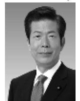
公明党代表 山口那津男