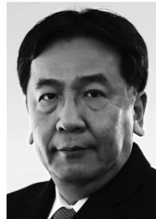
立憲民主党 代表 枝野幸男