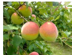
気候変動に対応したウメの着果安定技術の確立

沿岸漁業の再生 1,135万円(1,200万円) 水産振興課 藻場再生等、沿岸漁場の再生に取り組む地域を支援