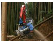
プロセッサ (木を一定の長さに切る)