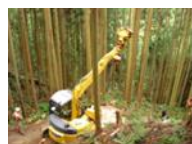
スイングヤーダ (木を引き出す)

紀州材の生産・加工を行う事業者に対し、生産性向上や生産コスト低減に資する機械設備導入を支援するほか、販路開拓に向けた製材所の既存設備高度化を支援