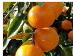
高温下におけるウンシュウミカンの品質向上技術の確立