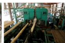
既存製材設備の高度化