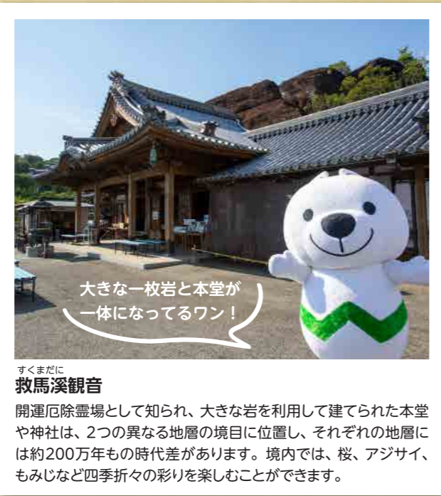
大きな一枚岩と本堂が一体になってるワン! 救馬溪観音 開運厄除霊場として知られ、大きな岩を利用して建てられた本堂や神社は、2つの異なる地層の境目に位置し、それぞれの地層には約200万年もの時代差があります。境内では、桜、アジサイ、もみじなど四季折々の彩りを楽しむことができます。