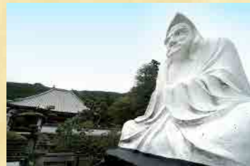
興禅寺(通称:だるま寺) 臨済宗妙心寺派の寺院で、境内には日本一のだるま座像や回遊式の美しい庭園があります。