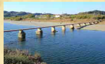
富田川の潜水橋 氾濫を繰り返してきた富田川では、洪水で破壊されない橋を架ける必要があり、水の抵抗を受けるらんかんのない潜水橋が架けられています。