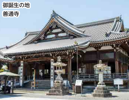
御誕生の地 普通寺