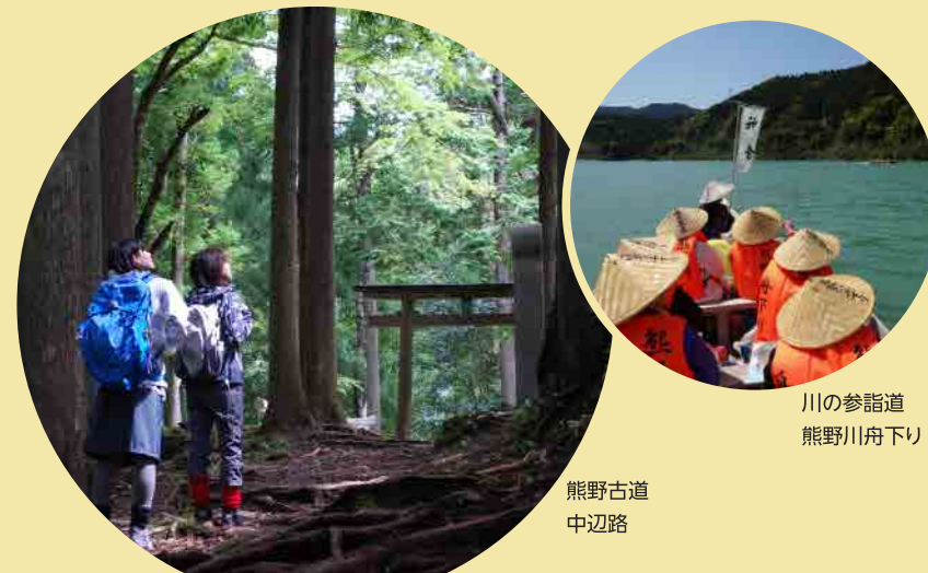
川の参詣道 熊野川舟下り