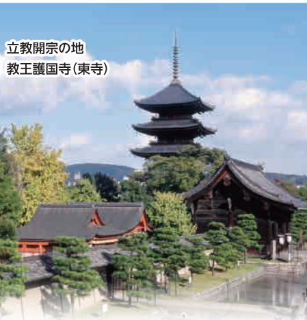
立教開宗の地 教王護国寺(東寺)