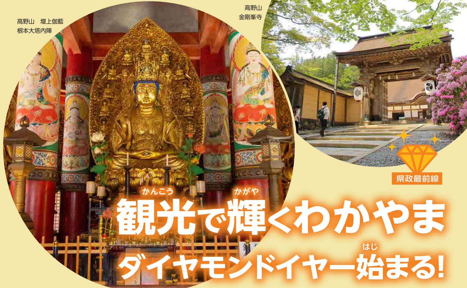
高野山 壇上伽藍 根本大塔内陣