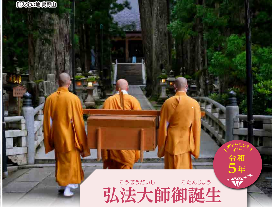
御入定の地 高野山