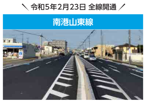
国際拠点港湾 和歌山下津港と近畿自動車道紀勢線と和歌山南SIC (スマートインターチェンジ) とを連絡

空港の利便性向上や港湾の物流効率化等を図るため、空港・港湾施設と高速道路等とのアクセス性を向上させる幹線道路の整備に取り組んでいます。