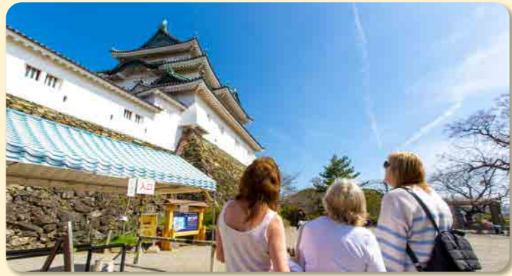
和歌山城を見学する外国人観光客