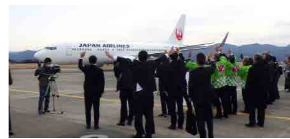
臨時便運航記念式典(令和5年2月)

コロナ禍からの航空需要の回復・拡大を見据え、航空旅客の利便性向上を図るため、南紀白浜空港と羽田空港間を1日3往復6便で運航している定期便の4往復8便化の実現をめざしています。県内での観光・ビジネス需要の喚起、首都圏等からの誘客促進を推進します。