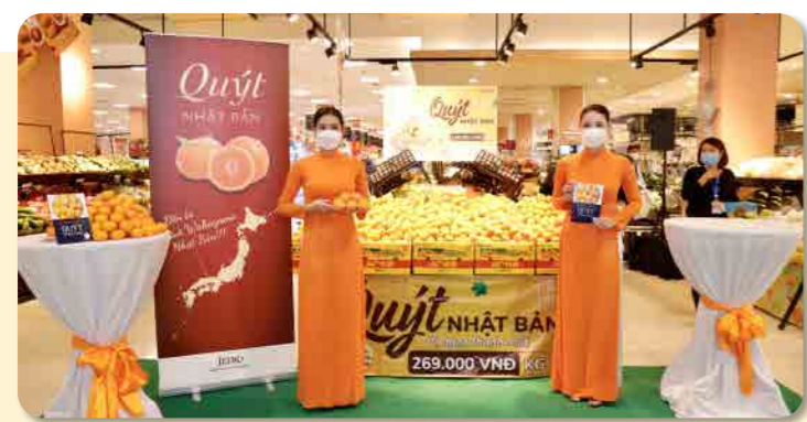
ベトナム 和歌山みかんフェア

県では、空港・港湾の機能強化や道路ネットワークの整備を推進することにより、和歌山と世界との距離を一層近づけ、農産物や工業製品等の更なる輸出拡大、コロナ禍で落ち込んだ外国人観光客の受入強化や国際交流の推進などを図り、「世界とつながる和歌山」の実現をめざします。