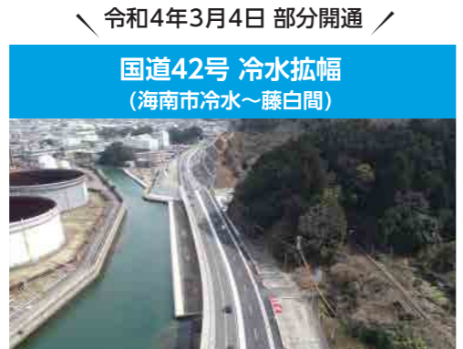
今後、ENEOS和歌山製油所での製造が期待される持続可能な航空燃料 (SAF) の円滑な輸送に寄与