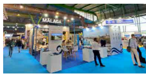
クルーズ見本市出展(スペイン)

ポストコロナや大阪・関西万博を見据え、インバウンド旅行需要の取込をめざすとともに、県内港湾へのクルーズ客船寄港誘致活動を進めていきます。