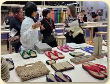
フランス インテリア見本市