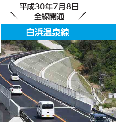
平成30年7月8日 全線開通