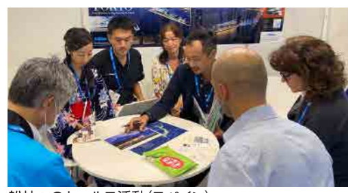
船社へのセールス活動(スペイン)