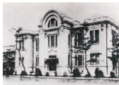
和歌山県水平社創立大会が開かれた当時の和歌山市公会堂

同和問題は、日本社会の歴史的発展の過程で形づくられた身分階層構造に基づく差別です。1871年に明治政府は、いわゆる「解放令」を出し、江戸時代までの身分制度を廃止しました。しかし、明治政府は差別を解消する施策を実施せず、差別は残されたままでした。このため、差別撤廃を求めて、被差別部落の人たちが立ち上がり、1922年3月3日に全国水平社が創立されました。その動きは全国に広がり、翌1923年5月17日には、和歌山県水平社が創立されました。 今年、和歌山県水平社が創立されてから100年を迎えます。県においても同和問題の解決に向け取り組んできた結果、多くの分野でさまざまな成果を上げるなど同和問題は解決に向かっていますが、依然として許し難い差別発言やインターネット上への差別書き込みが発生するなど、部落差別は現実の問題として残されています。 このことから、県では、2020年に「和歌山県部落差別の解消の推進に関する条例」を施行し、県民の皆さんとともに部落差別のない社会の実現をめざし取り組んでいるところです。 部落差別は基本的な人権の侵害であり、決して許されない行為です。私たち一人ひとりが同和問題を正しく理解し、他人事ではなく自分自身の問題として捉え、差別や偏見のない豊かで明るい社会を築いていきましょう。