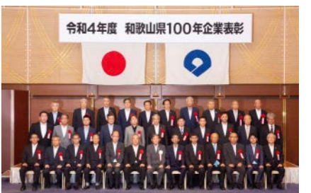
令和4年度 和歌山県100年企業表彰

5日 デジタル化推進シンポジウム 県内企業のデジタル技術活用による新たなサービスの創出や生産性の向上に向けたデジタル化に精通したゲストを招く