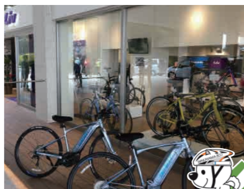
サイクルステーション