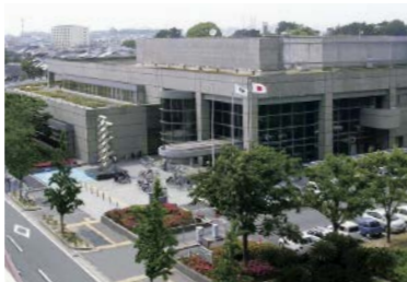
県立図書館(和歌山市)