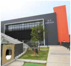
海南市海南図書館