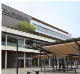
和歌山市民図書館