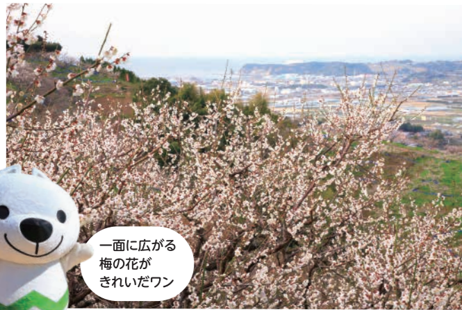
一面に広がる梅の花がきれいだワン

みなべ町での梅栽培の歴史は古く、長年の研究を経て育成された「南高梅」は、トップブランドとして高い評価を受けています。ほかにも、高度な製炭技術で作る「紀州備長炭」も有名です。また、海岸線沿いには景勝地も多く、本州一のアカウミガメの産卵地で知られる「千里の浜」や、かつて熊野詣の人々が歩いた熊野古道の一部として、歴史を感じる見所もたくさん。この時期は、観梅とあわせてみなべ町をお散歩しませんか。