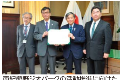
南紀熊野ジオパークの活動推進に向けた和歌山大学との相互連携協定調印式