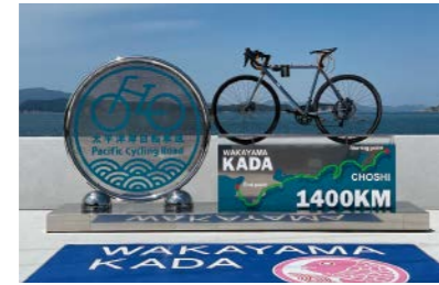
ナショナルサイクルルート

和歌山県誕生150年 県内各地で繰り広げられたさまざまなイベントを総括することも、未来に向けた決意を発信するステージプログラムを展開