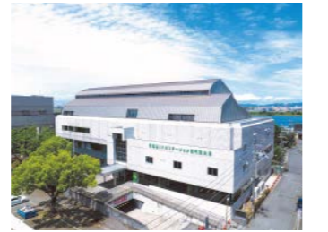
和歌山リハビリテーション専門職大学