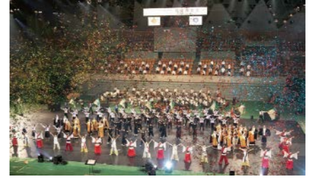
紀の国わかやま総文2021総合開会式