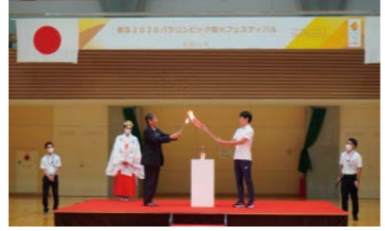
東京2020パラリンピック聖火フェスティバル