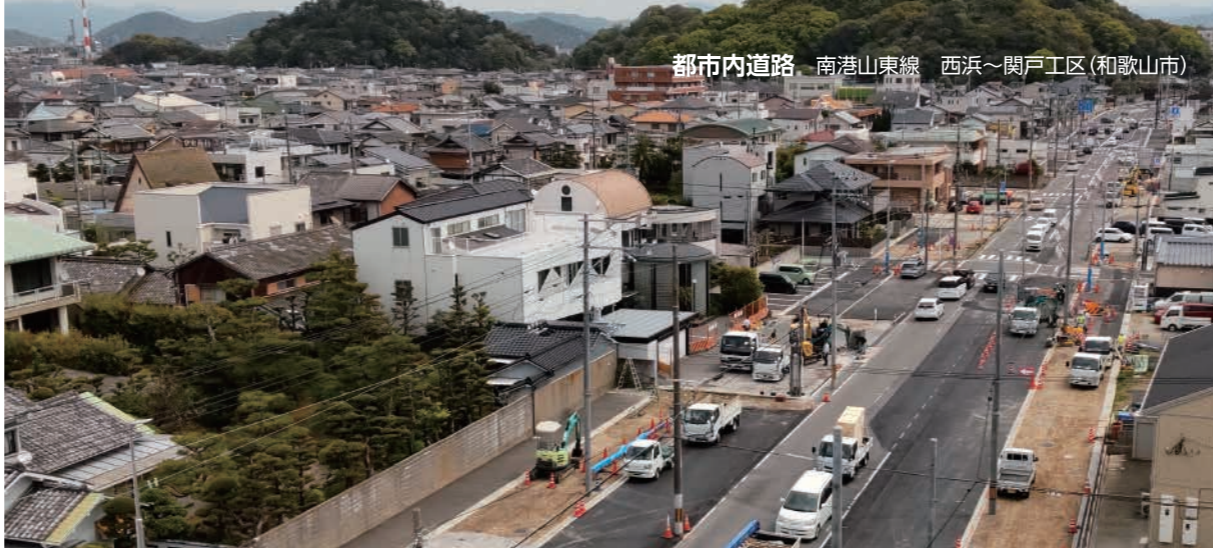
都市内道路 南港山東線 西浜～関戸工区(和歌山市)