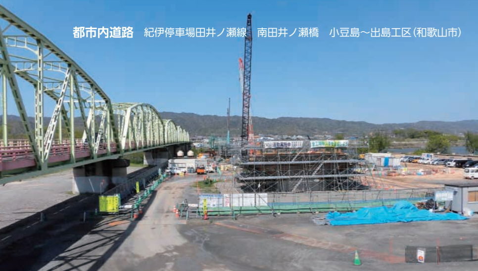
都市内道路 紀伊停車場田井ノ瀬線 南田井ノ瀬橋 小豆島～出島工区(和歌山市)