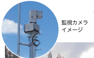
監視カメライメージ