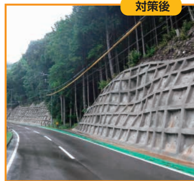
国道169号(東牟婁郡北山村)

豪雨による土砂災害などの発生を防止するため、のり面对策を進め、通行の確保に取り組んでいます。