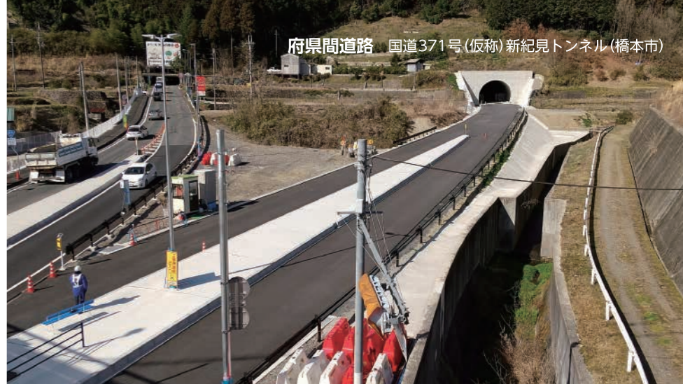
府県間道路 国道371号(仮称)新紀見トンネル(橋本市)