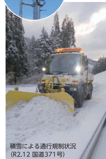
積雪による通行規制状況(R2.12 国道371号)

異常気象時などの道路状況を速やかに把握するため、道路監視カメラの設置を進め、円滑な交通の確保に努めます。