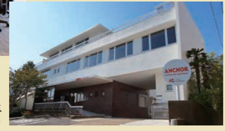
新ITビジネスオフィス ANCHOR(アンカー)