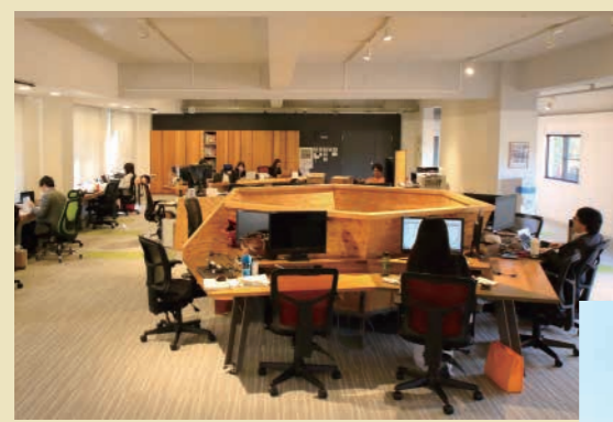
和歌山に本社を移転したIT企業のオフィス

県では、ワーケーションの取組とあわせて、和歌山の強みであるビジネス環境や、住宅・教育・医療などが一体となった快適な生活環境を活かし、大規模オフィスの誘致や移住定住の推進に取り組んでいます。 ワーケーションをきっかけとした将来の移住者の増加や企業誘致にも繋げて、さらなる地域交流の促進や、地域経済の活性化などが期待できます。