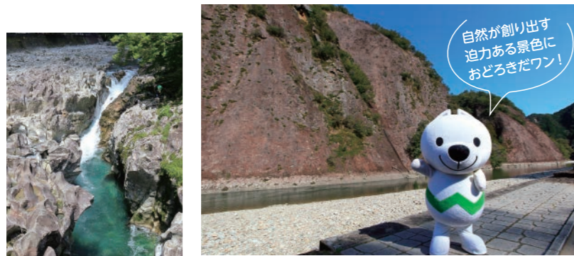
一枚岩 約1,400万年以上前の火山でできた幅500m、高さ100mの巨大な岩壁は、古座川を代表する観光スポット。

滝の拜 古座川の支流小川にある落差8mの滝が中央にあり、大小さまざまな奇形の岩穴(ポットホール)がある不思議な地形。