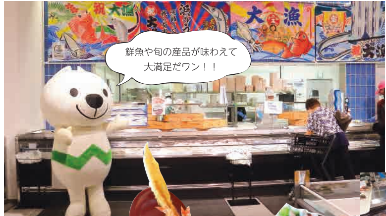
鮮度抜群な「海鮮丼」1,500円(右)とびっくり突き刺さる「天然海老と太刀魚の天丼」1,580円。

和歌山県PRキャラクター「きいちちゃん」の地である有田市では、400年以上のみかん栽培の歴史があり、甘みと酸味のバランスが絶妙な有田みかんブランドは、全国的にも人気を集めています。 また、漁業も大変盛んで、箕島漁港でのタチウオの漁獲量は日本一を誇ります。 そこで今回は、5月末にオープンしたばかりの「新鮮市場 浜のうたせ」取材しました。漁師さんにとって思い入れの深い、地元「辰ヶ浜」と「うたせ船」から名付けられた施設名。直売施設・飲食施設体の産直施設として連日賑わっています。