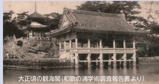
大正頃の観海閣

新 日本遺産『絶景の宝庫 和歌の浦』を活用したまちづくりの促進 2億5,625万円 日本遺産「絶景の宝庫 和歌の浦」の価値を高めるため、和歌公園「観海閣」の復元的整備や無電柱化を行い、官民協働による歴史まちづくりを促進します。