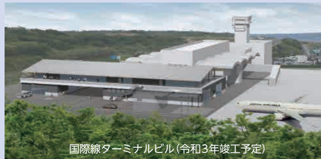
国際線ターミナルビル(令和3年竣工予定)

拡 空港・港湾を活用した誘客促進 14億1,061万円 南紀白浜空港の機能強化や大型クルーズ客船寄港増に向けた支援制度の創設などにより、空港・港湾を活用した誘客をさらに促進します。