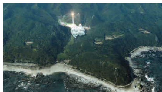
発射場イメージ

「スペースポート紀伊」には、ロケットを打ち上げる射点に加え、射場全体の管理・運営のほか、人工衛星の整備や点検、ロケットの発射管制を行う施設(総合指令棟)やロケットの組立や点検を行う施設(ロケット組立棟)などが建設される予定です。