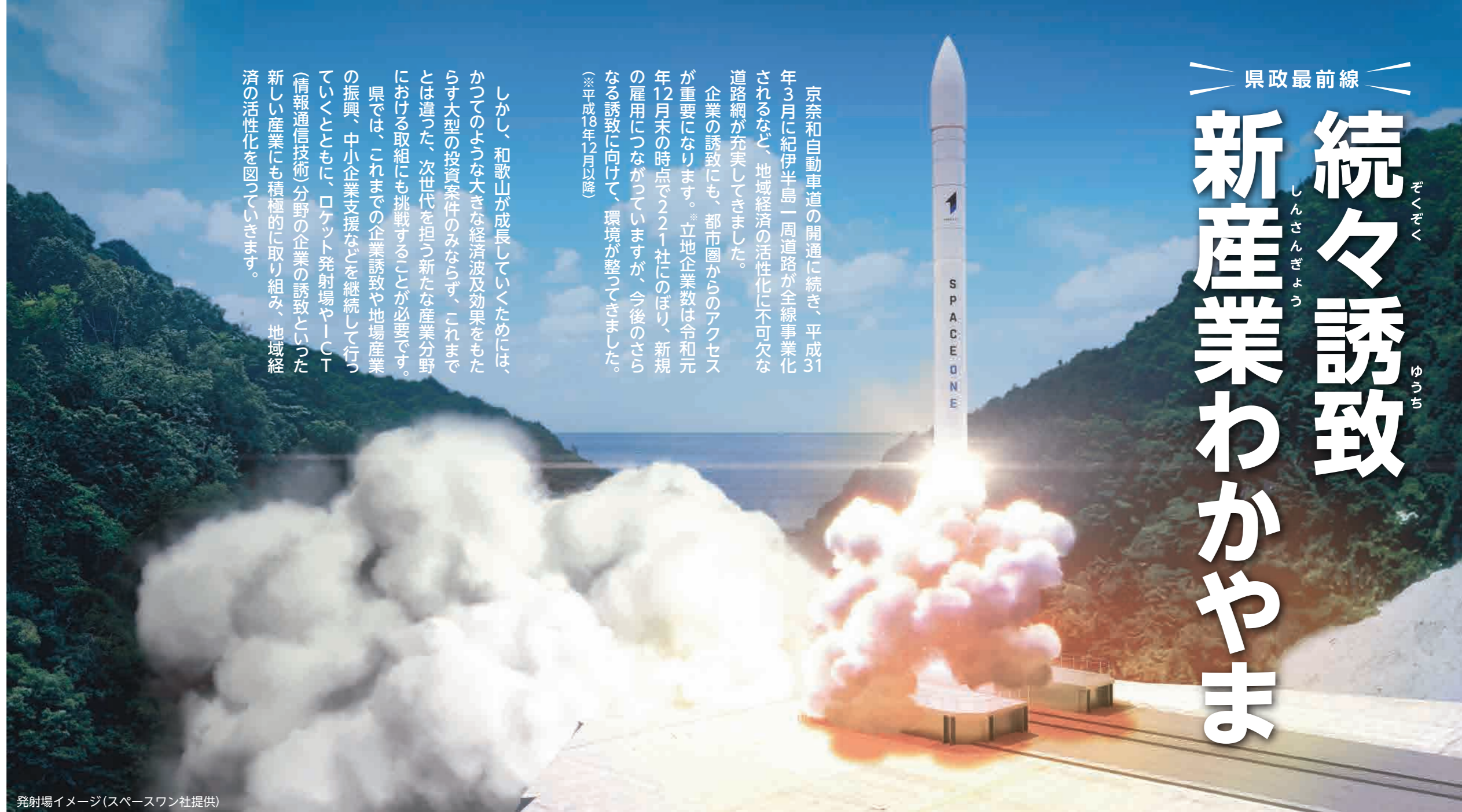
発射場イメージ

京奈和自動車道の開通に続き、平成31年3月に紀伊半島一周道路が全線事業化されるなど、地域経済の活性化に不可欠な道路網が充実してきました。