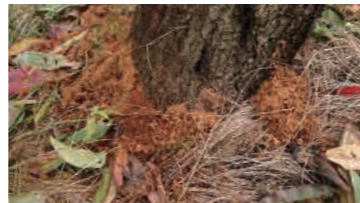
株元にたまったフラス