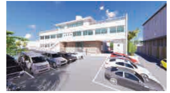
新ICTオフィスビル 完成イメージ

紀南地域において、田辺市で昨年2月に竣工した秋津野グリーンオフィスに3社が入居しています。白浜町では、2カ所のビジネスオフィスに「株」セールスフォース・ドットコムなど計10社が入居し、満室となっています。また、「クオリティソフト(株)」のように、保養所を改修して本社を移した企業も出てきました。 企業の受け入れに重要なビジネスオフィスの整備については、今年度、民間事業者に対する支援制度を設けました。この支援制度を活用した民営のビジネスオフィスが、今年の夏に白浜町で完成する予定です。