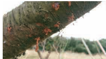
ミンチ状のフラス