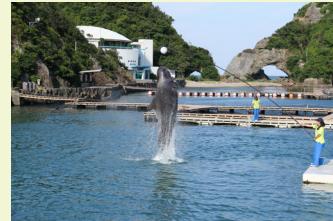
イルカ・クジラショー 迫力満点のショーは、どちらも1日4回ずつ開催されます。ダイナミックにジャンプするイルカやクジラの姿は圧巻です。