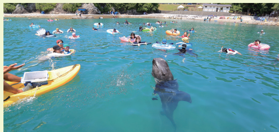
くじらに出会える海水浴場 くじら浜海水浴場で行われるクジラと一緒に遊泳できるイベントは毎年多くの人で賑わいます。【1日2回15分程度、8月19日(月)まで開催中】