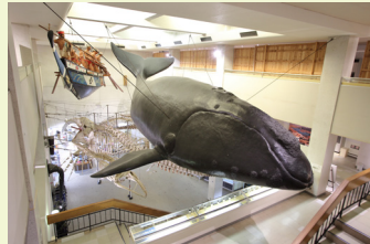
博物館本館 「古式捕鯨」を再現したジオラマや、鯨の骨格標本・生態資料を展示で紹介しているほか、捕鯨に関する道具や絵巻など捕鯨の歴史を学ぶことができます。

今年開館50周年を迎えた「くじらの博物館」は、約400年以上にわたってクジラと深く関わってきたこの地域の歴史文化を伝えるとともに、クジラの生態に関するさまざまな資料を展示している世界一のスケールを誇る博物館です。自然の入江を仕切って作られた自然プール周辺では、クジラやイルカを間近で観察することができるショーやふれあい体験が楽しめます。