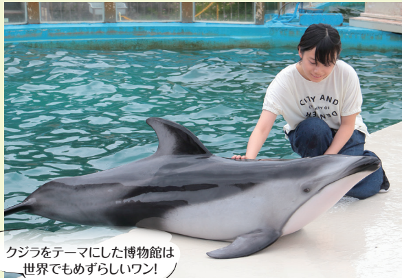
クジラをテーマにした博物館は世界でもめずらしいワン!