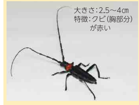
大きさ:2.5~4cm 特徴:クビ(胸部部分)が赤い

幼虫はサクラやウメ、モモなどの樹を食い荒らして枯死させます。現在、大阪府、徳島県など7都府県で被害が確認されており、本県では平成29年7月にかつらぎ町で成虫一匹が捕獲されました。早期防除が必要のため、見つけた場合は殺虫のうえ、お知らせください。 問:県庁自然環境室