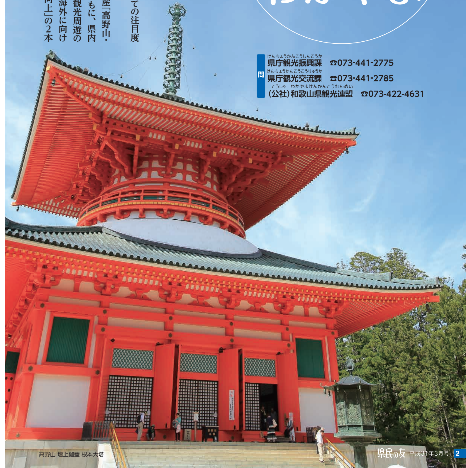
高野山 壇上伽藍 根本大塔