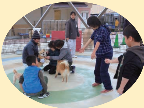
動物とのふれあいは、日時が決まっているのでWEBサイトなどで確認してね！

犬・猫の殺処分数を減らすため、譲渡を行っています。離乳前の犬猫を譲渡可能になるまで育てるミルクボランティアや新しい飼い主を探す譲渡ボランティアの協力もあって、譲渡数が飛躍的に増えています。犬猫を飼いたい方は、ぜひ一度訪れてください。