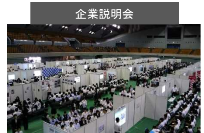
(応募前サマーガイダンス2018の様子)

開催日時：令和元年6月13日(木) 開催場所：和歌山ビッグホール・ビッグウェーブ 対象生徒：全県の高校生 約2,200人 参加企業：125社