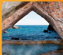
志保洞(那智勝浦町)