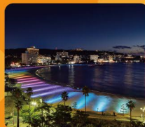
白浜ライトパレード(白浜町)