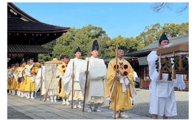
【令和の熊野詣 昨年度の出立式の様子】