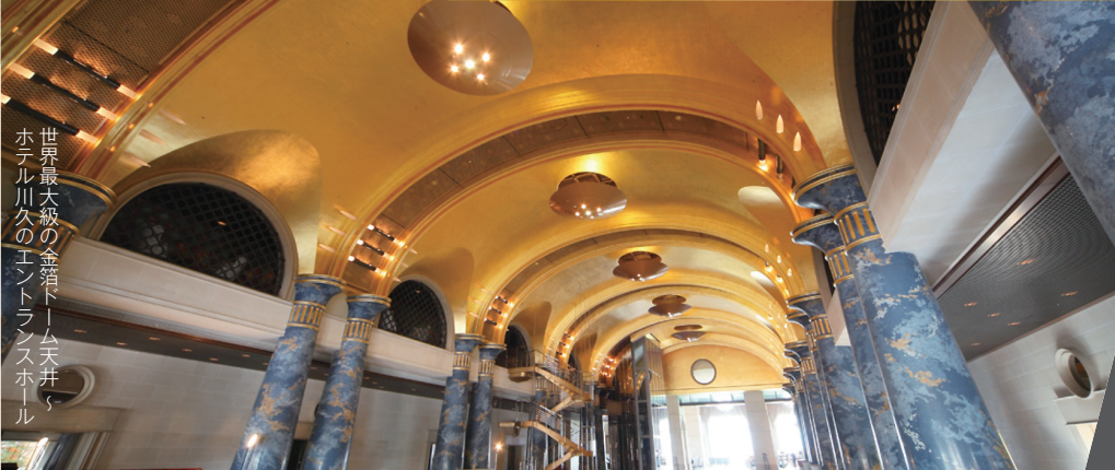
世界最大級の金箔ドーム天井ホテル川久のエンターテインメントホール