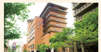
2日目 宝塚温泉 ホテル若水