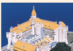
2日目 南紀白浜温泉 ホテル川久 (7室限定)