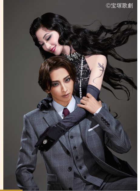
宙組公演 ミュージカルロマン「黒蜥蜴」

山形空港発着チャーター便ツアー 旅行期間：令和8年6月2日(火)～4日(木)・2泊3日