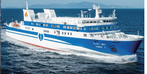
紀伊から阿波へ。紀伊水道を渡る2時間強の船旅。